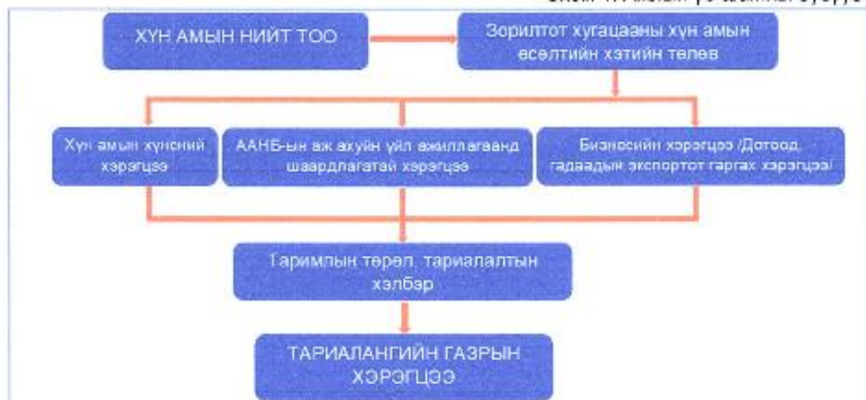
Схем 1. Ажлын үе шатны бүдүүвч

1.12. Энэхүү аргачлалын үе шат болон ажилбар хоорондын уялдаа, хамаарлыг дараах бүдүүвчээр харуулав.